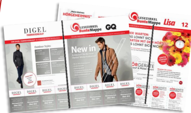
Umschlagseite mit Coupons